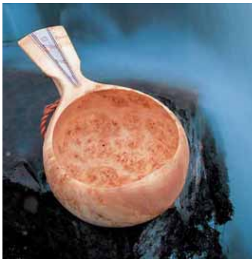
Jon Ole Andersen: guksi; riknute bjørk, horn, sølvstift, foto: Arvid Sveen.