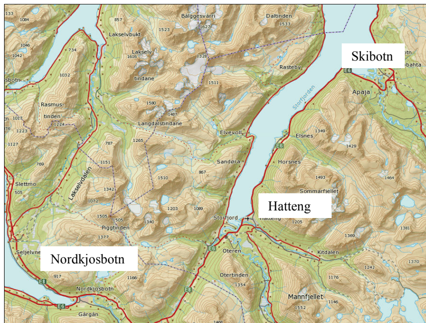
Figur 2. Oversiktskart

Planområdet ligger ved Hatteng, i Storfjord kommune, øst for Lyngenfjorden. Området ligger visa vers Storfjord rådhus og avgrensens av kommunal veger i vest, mot nord og i øst. I mot sør/sørøst avgrensnes planområdet av enkeltstående bolighus. Viser til figur 1 og 2.