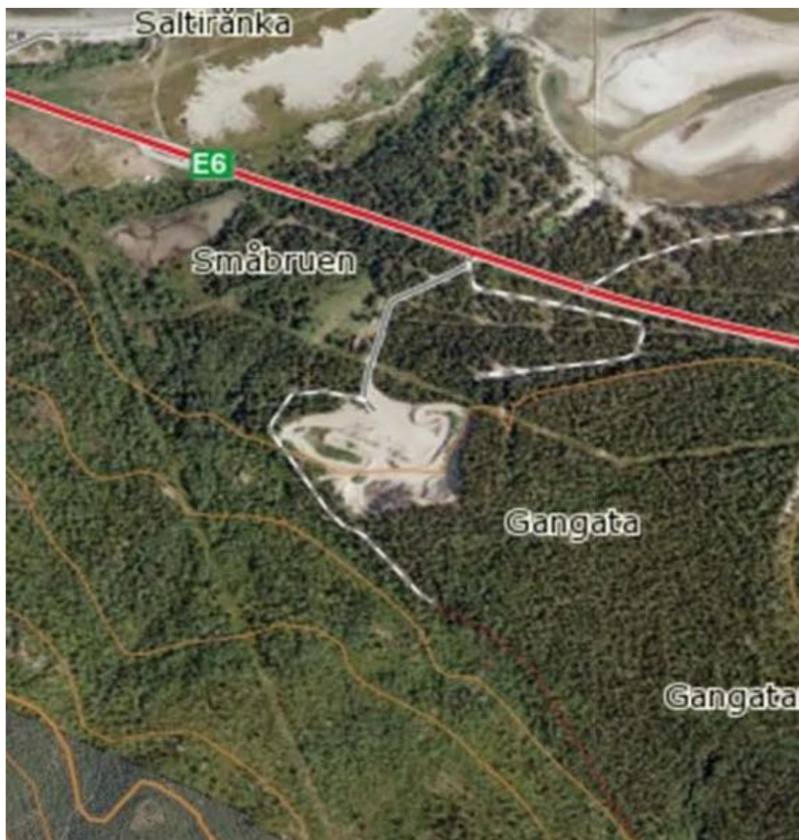
Figur 1. Detalj av flyfoto over planområdet fra Kart på Nett, Storfjord kommune.