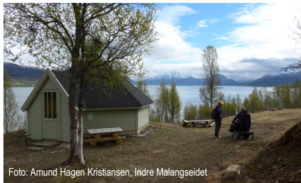
Indre Malangseidet