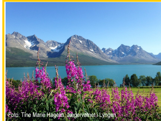
Jægervatnet i Lyngen

Adkomst: Rett vest for svingen ved Storelva ligger det en skogsbilvei mellom husene, med gjerde på hver side. Kjør denne opp til bommen. Parker der.