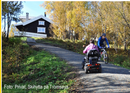
Skihytta på Tromsøya

Adkomst: Kjør inn mot Mortensnes fra fylkesvei 862. Etter ca. 600 meter ses lekeområdet til Ekrehagen Barnehage. Kjør inn på p-plass mellom barnehagen og Ekrehagen skole